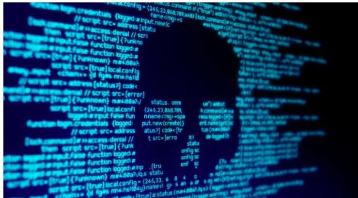
Ilustração de ciberataque.

Um recente levantamento do Tribunal de Contas da União (TCU) concluiu que boa parte dos órgãos públicos federais do Brasil não estão com a proteção eletrônica adequada. De acordo com informações do Portal do TCU e do site Convergência Digital , a apuração identificou falhas importantes desde o tratamento de ativos não autorizados à ausência de correção de vulnerabilidades.