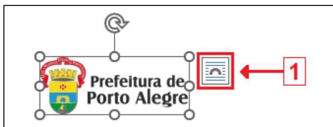
Figura 1 – Imagem no Microsoft Word 2016

QUESTÃO 21 – A Figura 1, abaixo, apresenta uma imagem que foi selecionada em um documento do Microsoft Word 2016, versão para computador, em sua configuração padrão e em português.