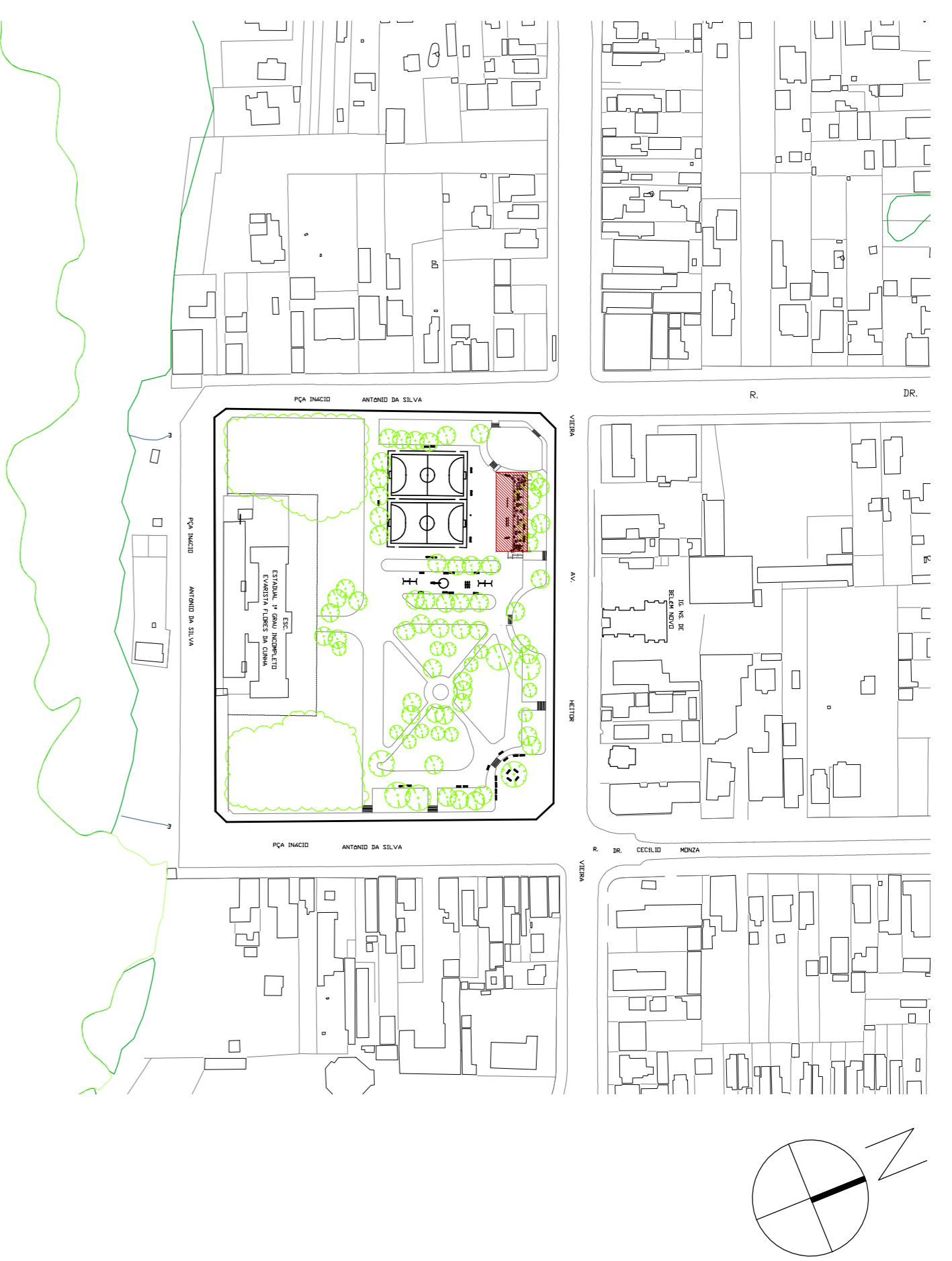
SITUAÇÃO ESCALA: 1/2000