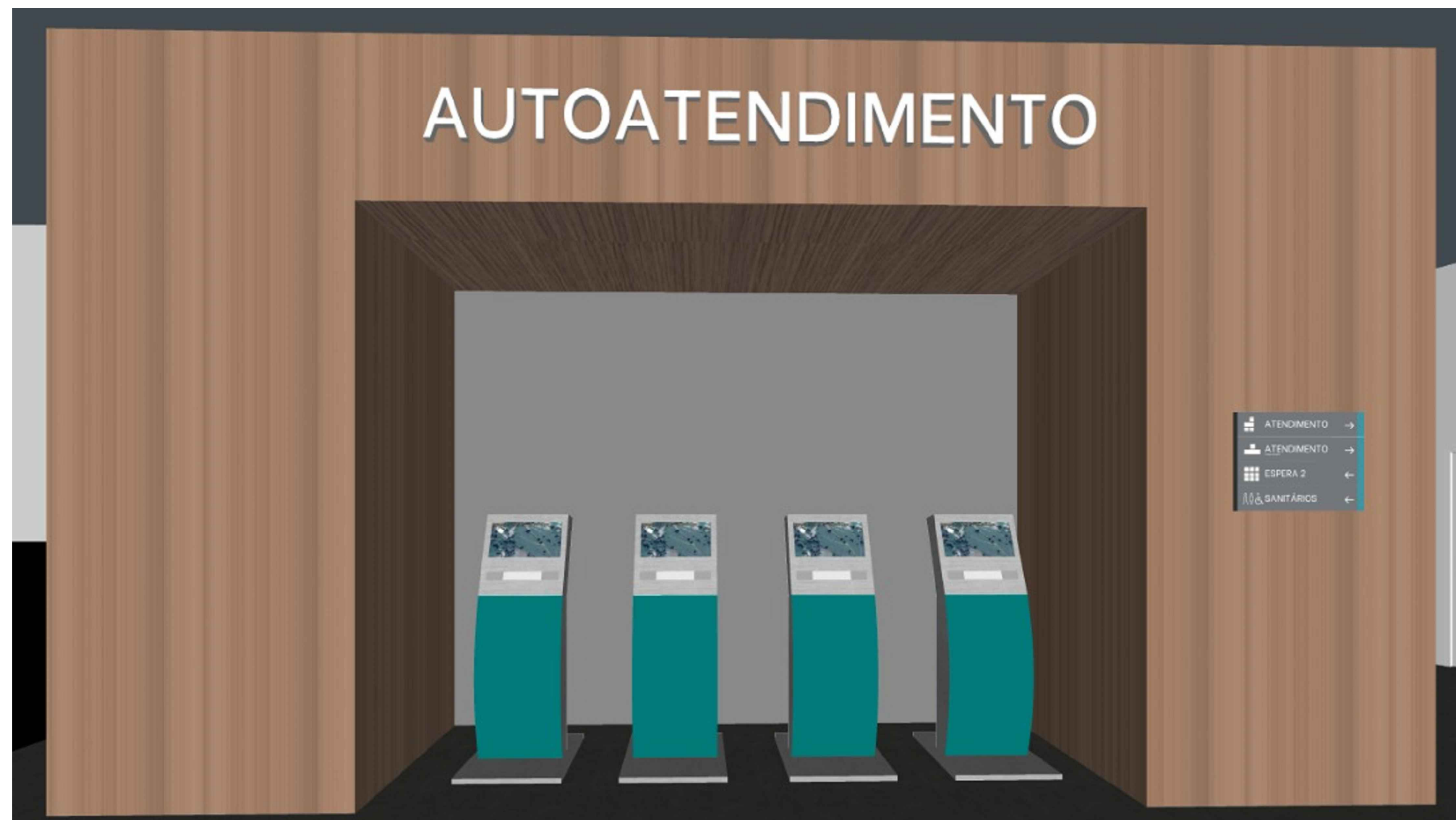
VISTA DO AUTOATENDIMENTO ESC.:S/E